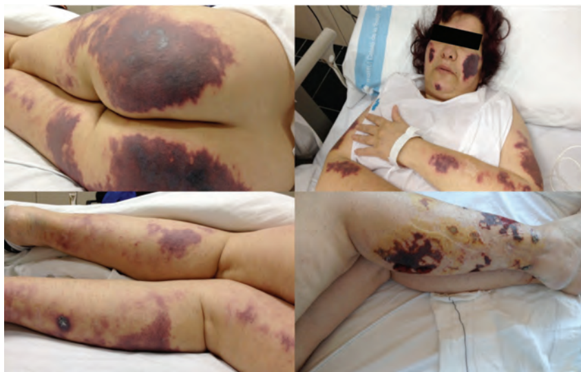
Figura 1. Lesiones vasculíticas en los glúteos, las extremidades y la cara de la paciente a su llegada a urgencias.

ta su diagnóstico, pero en consumidores habituales de cocaína, la detección del levamisol no se considera esencial para el diagnóstico. Desde el punto de vista inmunológico se puede observar la presencia de ANCA con patrón perinuclear en el 88% de los casos, aunque el patrón citoplasmático también está descrito. Otros hallazgos característicos son la positividad para los anticuerpos antifosfolípidos y los anticuerpos antielastasa. En nuestro caso la paciente presentó positividad para ANCA patrón perinuclear, anticuerpos antielastasa y anticuerpos antifosfolípidos positivos, que posteriormente se negatizaron 4,7 .