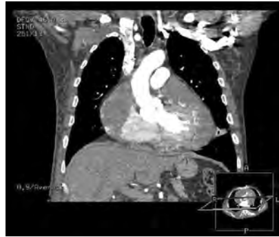
Figura 1. Imagen de tomografía computarizada.

El angiosarcoma pericardico es una entidad poco habitual y con frecuencia de difícil diagnóstico debido a que se presenta con síntomas y signos inespecíficos, pero la confirmación de invasión mediastínica y metástasis extracardiacas se logra a través de la tomografía computarizada (TC) y la resonancia magnética (RM). A pesar de los avances en las técnicas quirúrgicas, este tumor sigue teniendo un pronóstico infausto. Los tumores pericárdicos constituyen una causa relativamente frecuente de taponamiento cardiaco 1 . En la mayoría de ocasiones son de origen metastásico procedentes de tumores primarios de otros órganos. Los tu-